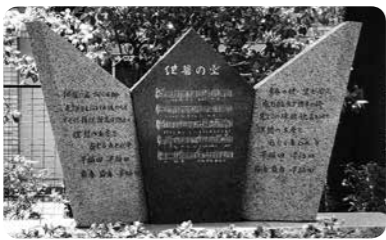
大隈会館前庭に建立された「紺碧の空」歌碑